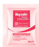
D 1 bustina Trattamento finale Balsamo Protettivo colore