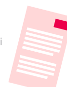
1 foglio di istruzioni