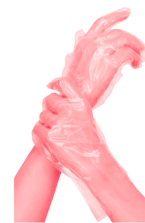
1 paio di guanti