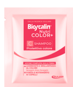
C 1 bustina Shampoo Protettivo colore